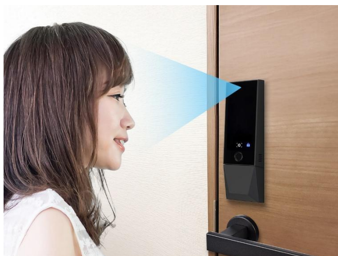
Arc FACE Home 使用イメージ